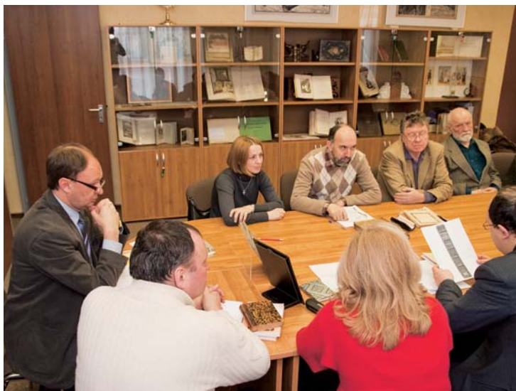
Заседание клуба «Библиофильский улей»

новки. Решая одну из главных задач сообщества — обмен информацией, участники заседаний в свободном диалоге рассказывают о новых приобретениях, обсуждают актуальные проблемы современного собирательства (например, повышение цен на антикварную книгу). Важнейшая часть работы — информирование о вновь выходящих изданиях «книжной» тематики.