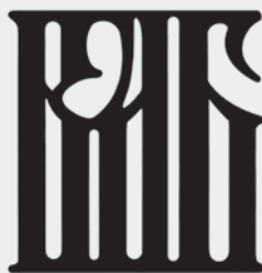
Эмблема Всероссийской ассоциации библиофилов