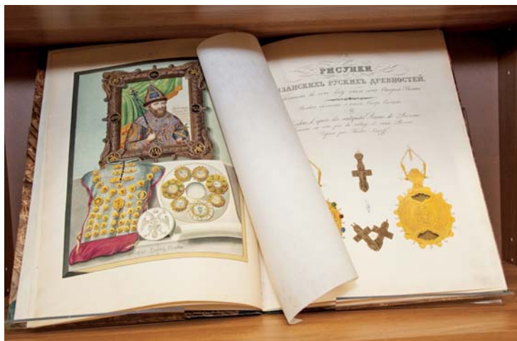
Однодневная выставка редких книг из собраний участников заседания