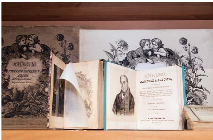
Однодневная выставка редких книг из собраний участников заседания