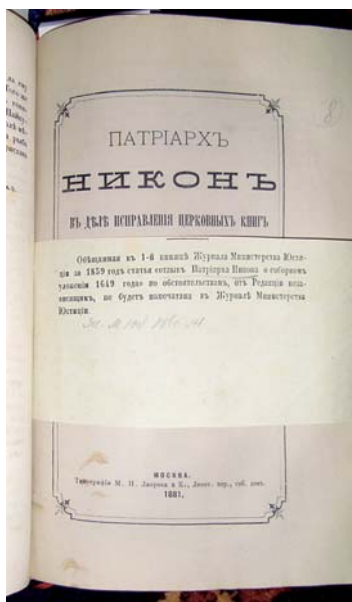
Патриарх Никон в деле исправления церковных книг и обрядов. М., 1881. Экземпляр из собрания П.А. Ефремова. Из собрания М.В. Сеславинского

столь красивым корешком, который может служить украшением любой библиотеки. В него вошли следующие издания: Гиббенет, Н.А. Историческое исследование дела патриарха Никона / Составил по официальным документам Н. Гиббенет: в [2 ч.]. СПб.: тип. Министерства внутренних дел, 1882–1884. [2], Ч. 1. [2], VIII, 270 с. Приплет 1: Переписка святейшего патриарха Никона с митрополитом Иконийским Афанасием и грамотоносцем иерусалимского патриарха Нектария Севастьяном или Саввою Дмитриевым // [Русский архив. № 9 за 1873 г.]. 1601–1640 стб. Приплет 2: Обличение на Никона патриарха, написанное для царя Алексея Михайловича // [Летописи русской литературы. Т. V. 1863 г.].