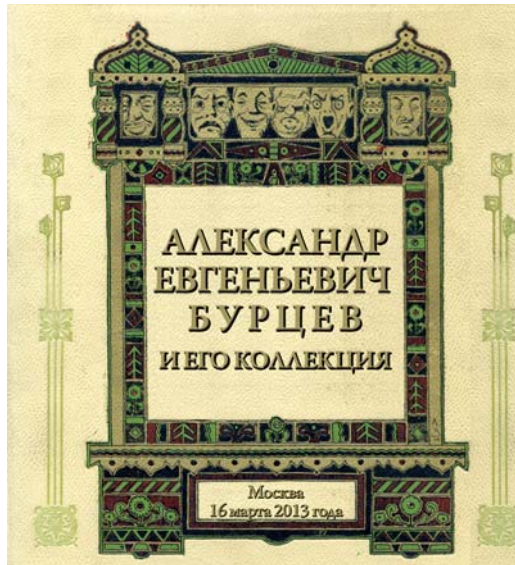
Афиша однодневной выставки «А.Е. Бурцев и его коллекция» в Государственной публичной исторической библиотеке. 16 марта 2013 г.