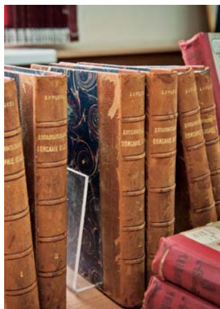
Труды А.Е. Бурцева из собрания ГПИБ