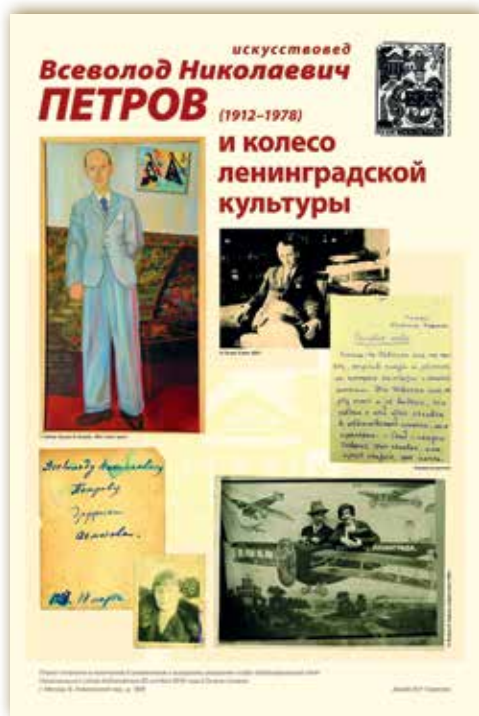
Плакат к заседанию клуба «Библиофильский улей», посвященному выставке «Всеволод Петров (1912–1978) и колесо ленинградской культуры». Дизайн В.Р. Садековой

их имена на страницах монографий и периодик. Выставку «Всеволод Петров (1912–1978) и колесо ленинградской культуры», рассказывающую об одной из важнейших фигур отечественного искусствоведения, посетили члены клуба «Библиофильский улей» Национального союза библиофилов.