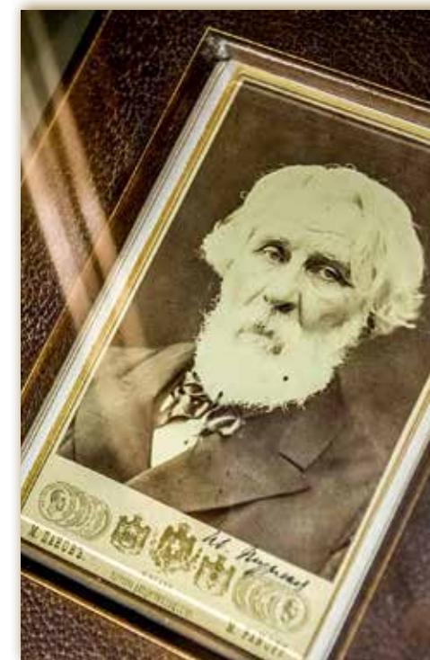
Фотография с автографом И.С. Тургенева в экспозиции Дома-музея писателя на Остоженке

Впечатлила подборка автографов писателя. Первым Сеславинский продемонстрировал инскрипт на 5-й части