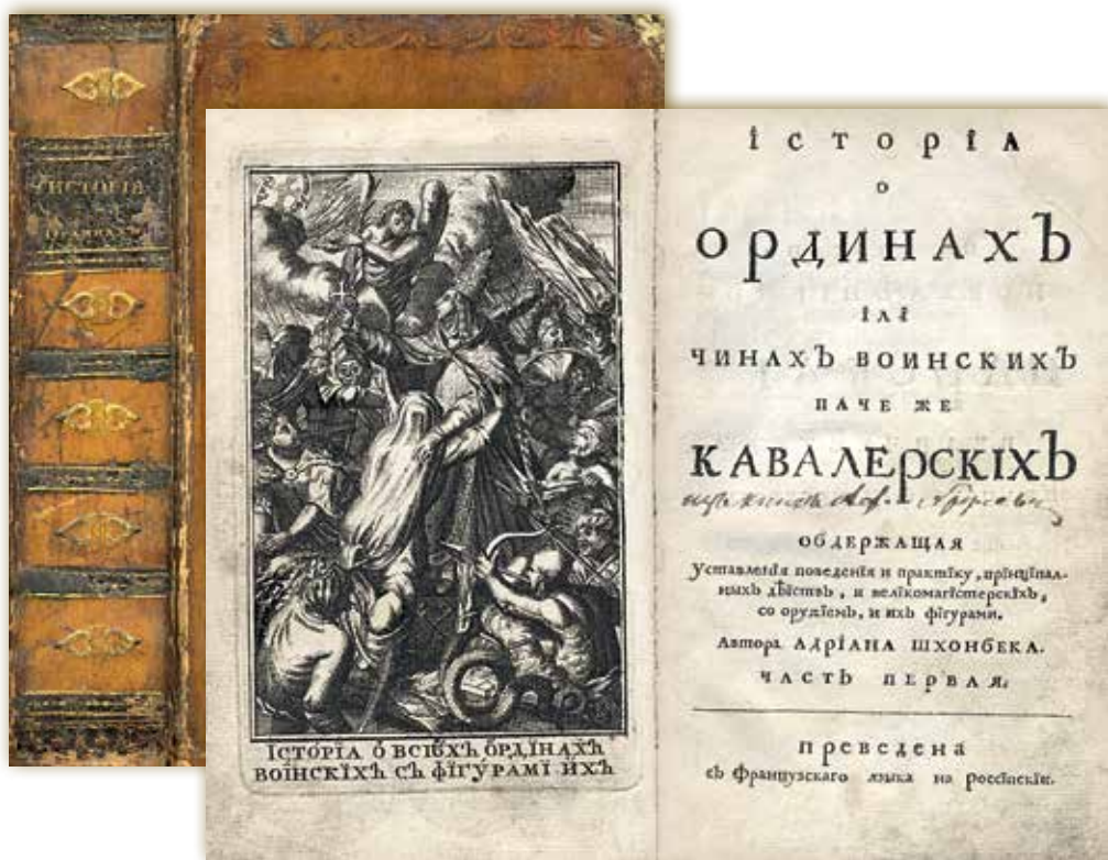
Переплет и титульный разворот книги Адриана Шхонебека «История о ординах или чинах воинских паче же кавалерских...» (М., 1710)

содержит 23 работы художника, каждая из которых издана литографским образом, как и плакаты.