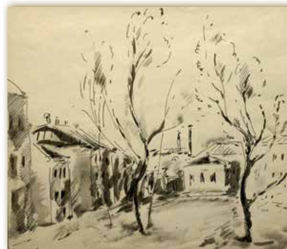
А.Ф. Софронова. Московская улочка с двумя деревьями. 1928. Бумага, акварель, тушь, перо