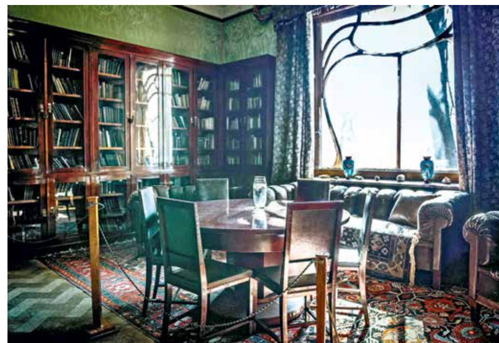
Интерьер музея-квартиры А.М. Горького в Москве

Успех заседания показал, что к теме истории и искусства эксиллибриса члены