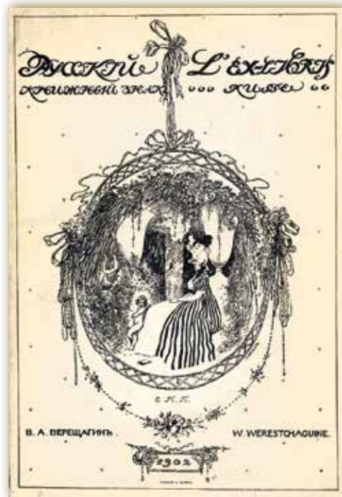
Обложка книги В.А. Верещагина «Русский книжный знак» (СПб., 1902)