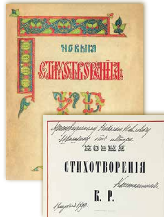
Обложка и титульный лист издания «Новые стихотворения К.Р.» (СПб., 1889). Дарственная надпись великого князя Константина Константиновича Н.П. Шишкину

ции — редкий томик «Сочинений» Г.Р. Державина (СПб., 1816) с подписью автора на шмуцтителе.