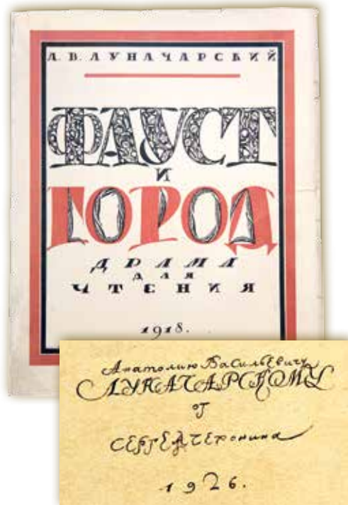
С.В. Чехонин. Обложка книги А.В. Луначарского «Фауст и город» (Пг., 1918). Дарственная надпись С.В. Чехонина А.В. Луначарскому