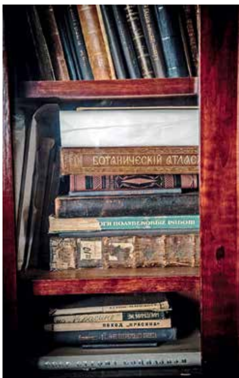
Книги из собрания музея-квартиры А.М. Горького в Москве

завсегда и «Библиофильского улья» смогли лицезреть книжные сокровища писателя.